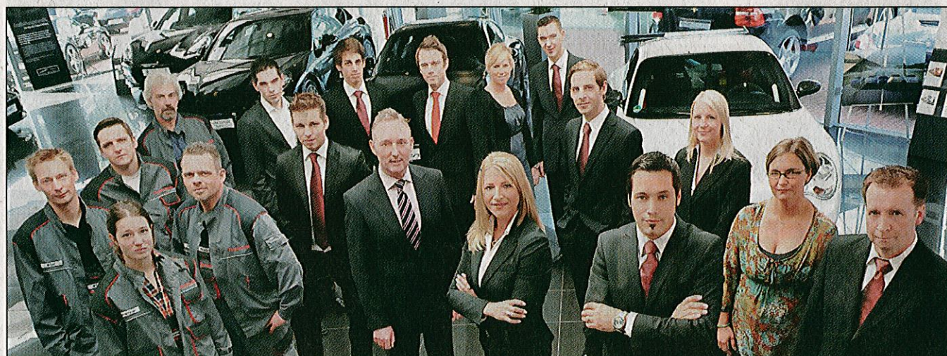
Das Team des Porsche Center Soest freut sich auf Sie!

Kraftstoffverbrauch l/100 km (PDK): innerstädtisch 11,2 · außerstädtisch 6,5 insgesamt 8,2 · CO 2 -Emission: 194 g/km