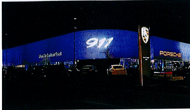
Nach nur acht Monaten Bauzeit konnte das neue Porsche Zentrum in Soest eröffnet werden.