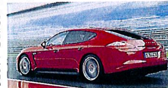
Der Porsche Panamera GTS.

Der Panamera GTS kommt im Februar 2012 auf den Markt und kostet in Deutschland 116.716 Euro einschließlich Mehrwertsteuer.