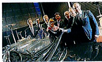
Das neue Porsche Zentrum Soest hat seine Tore geöffnet. Nachdem die alten Räumlichkeiten zu klein geworden waren, werden nun auf 6000 Quadratmetern edle Automobile und Serviceleistungen angeboten. Damit ist auch ein idealer Rahmen entstanden, um die neuen Modelle von Porsche wie aktuell den 911 zu präsentieren.

Edle Automobile und Serviceleistungen haben nun viel mehr Platz. Das neu gebaute Porsche Zentrum in Soest hat nicht nur seine Räumlichkeiten vergrößert, sondern auch sein Personal aufgestockt. Der Grundstein für eine Erfolgsgeschichte ist gelegt.