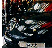
Hans-Joachim Stuck (l.), ein begeistertes Publikum und der neue 911 im Porsche Zentrum Dortmund.

Was kommt 2012? Da dürfen wir uns in der ersten Jahreshälfte auf die neuen Cabriolets freuen. Was es sonst noch für Modelle geben wird, dürfen wir aktuell noch nicht verraten. Aber Sie können sicher sein, dass wir noch nicht am Ende sind.